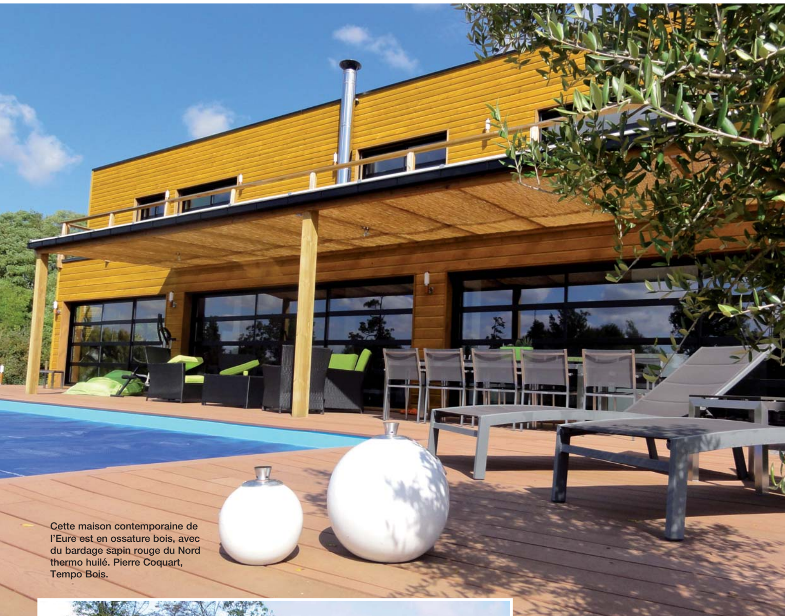
Cette maison contemporaine de l'Eure est en ossature bois, avec du bardage sapin rouge du Nord thermo huilé. Pierre Coquart, Tempo Bois.