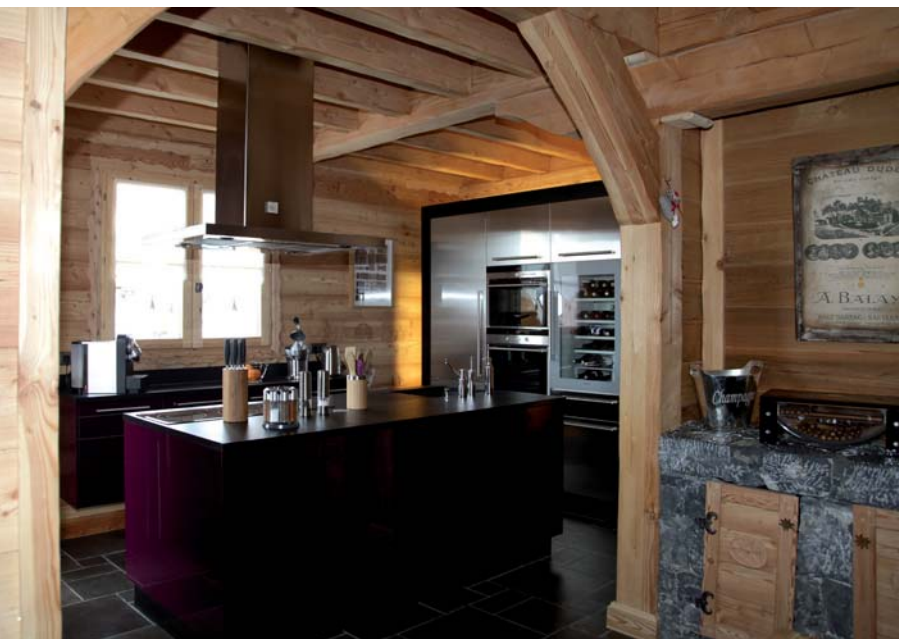
► ▲ Les architectes de Lombard Vasina maîtrisent les techniques des madriers et celles des poteaux-poutres, si bien qu'il est possible de mixer les deux avec des combles en madriers empilés sur un rez-de-chaussée ou étape en poteaux-poutres. Lombard Vasina.