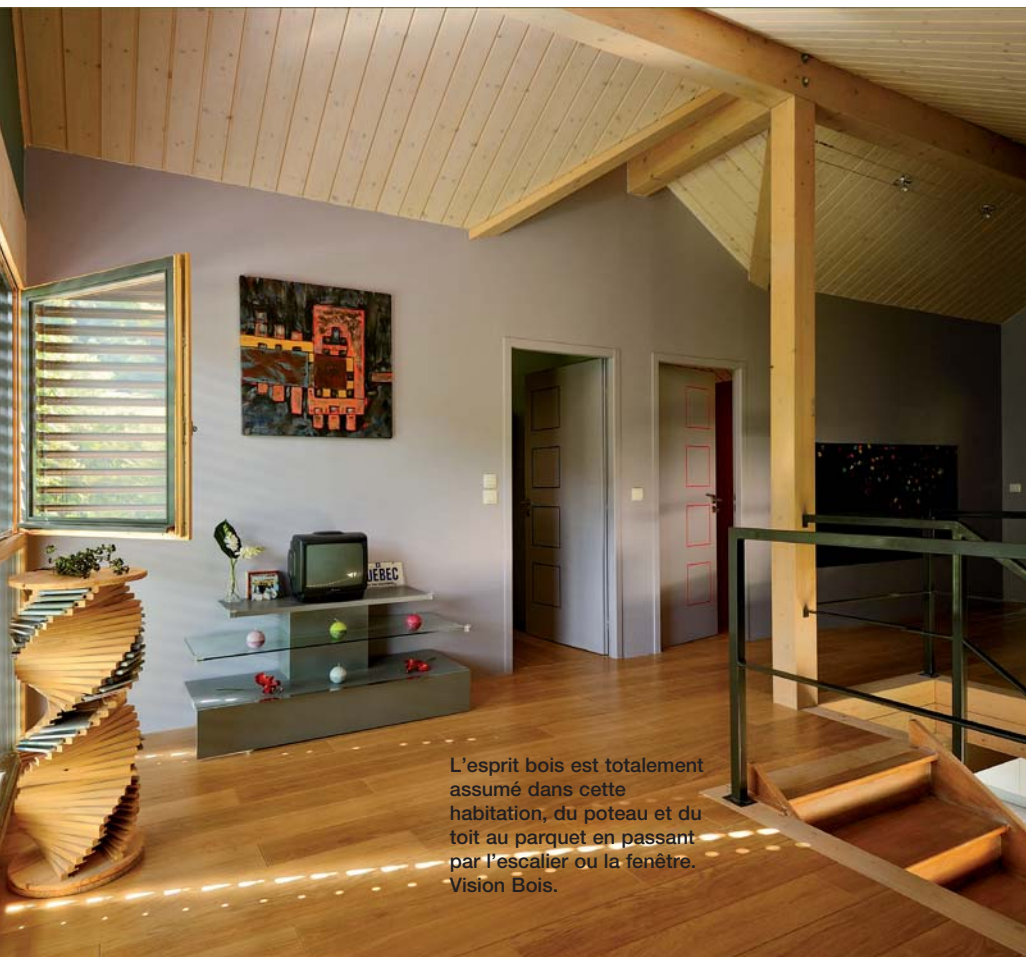
L'esprit bois est totalement assumé dans cette habitation, du poteau et du toit au parquet en passant par l'escalier ou la fenêtre. Vision Bois.