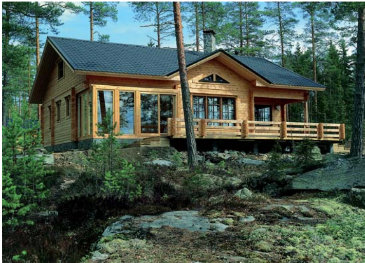
▲ À l'image de ce modèle d'habitation, de loin la plus populaire, Esprit Nature Bois parie sur le bois massif et le madrier. Esprit Nature Bois.