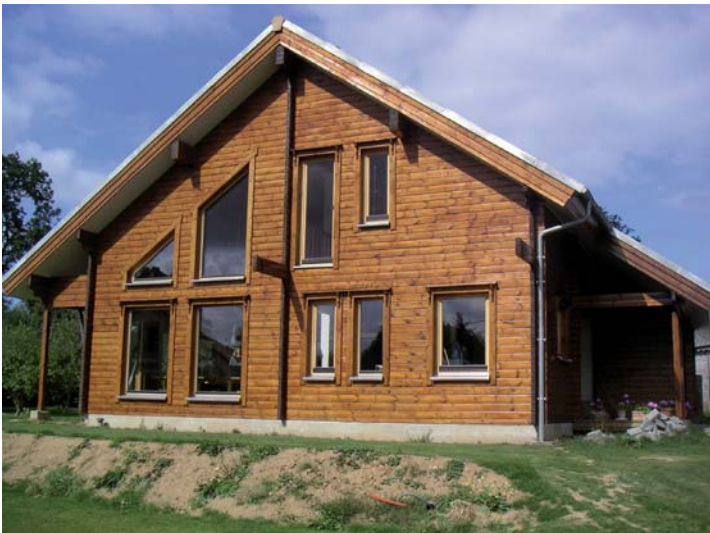
▲ La société Esprit Nature Bois, qui propose des maisons en kit, garantit l'origine finlandaise du bois, gage de qualité.

jour d'hui plus uniquement d'une mode mais bien d'une tendance de fond. Les causes ? Le développement durable désormais ancré dans la conscience collective, les économies d'énergie sur le long terme, l'esthétique «nature»... Du type d'habitat souhaité dépend le professionnel le mieux adapté. Maison en bois rime, pour l'heure, avec maison d'architecte. Donc sur-mesure et plutôt haut de gamme. Cette