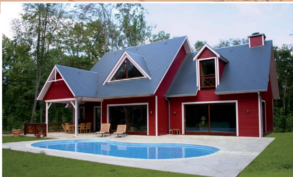
◀ Les fantaisies colorées les plus audacieuses sont possibles avec le bardage en sapin rouge du Nord. Pierre Coquart, Tempo Bois.

Esprit Nature Bois ou Biokit-Habitat. La société Honka avance d'ailleurs que le choix de la maison bois en kit permet d'économiser jusqu'à 30% sur le