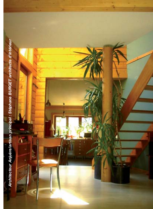
Architecteur Anjuère/artisan principal : Stéphane BURGET architecte d'intérieur