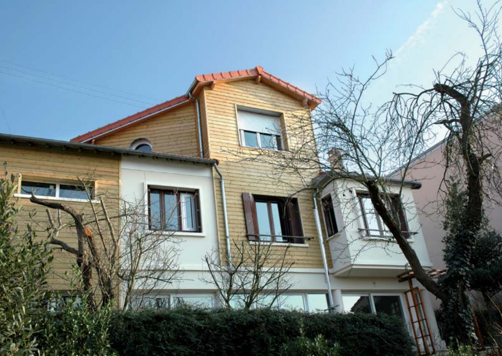
Architecteur Anjuère/artisan principal : Stéphane BURGET architecte d'intérieur